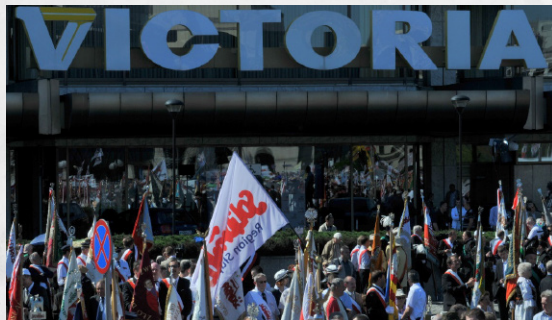
Beatyfikacja ks. J. Popiełuszki 6.06.2010r.