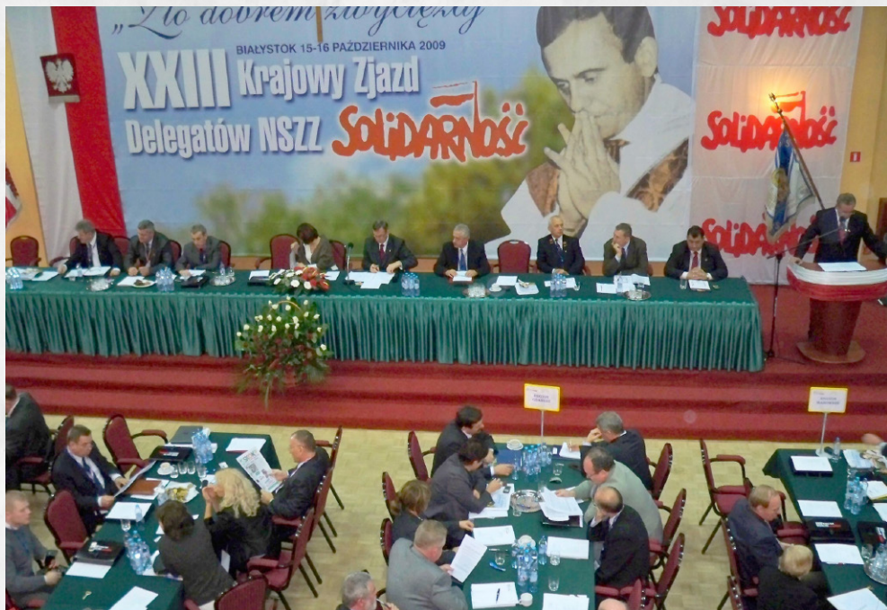
XXIII Krajowy Zjazd Delegatów NSZZ „Solidarność”, Białystok 15-16.10.2009r.