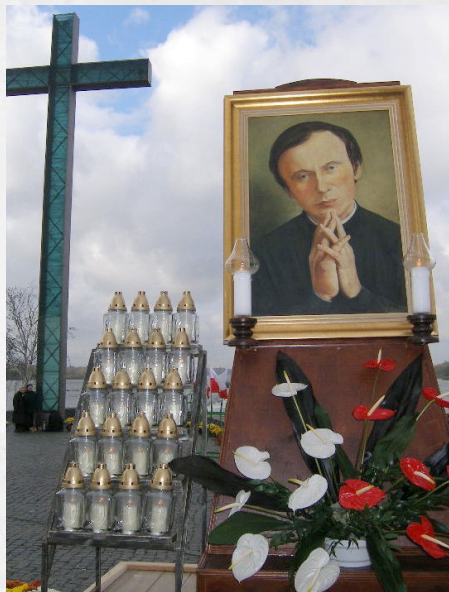
Włocławek – Tama na Wiśle

Praca duszpasterska w kościele św. Anny okazała się zbyt wyczerpująca i został przeniesiony jako rezydent 20 maja 1980 do kościoła św. Stanisława Kostki. Tam prowadził duszpasterstwo średniego personelu medycznego. Rok później został mianowany diecezjalnym duszpasterzem służby zdrowia i kapłanem Domu Zasłużonego Pracownika Służby Zdrowia.