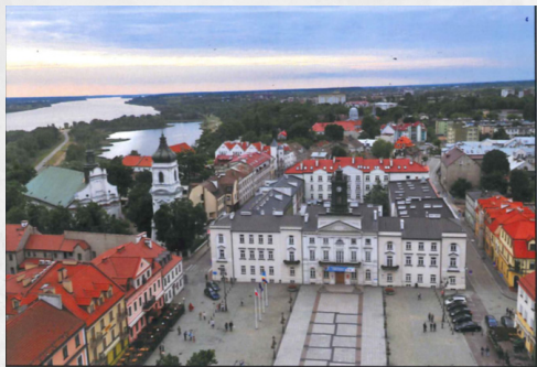
Plock – Most im. Legionów Piłsudskiego, rzeka Wisła, Wzgórze Tumskie, Stary Rynek i Ratusz