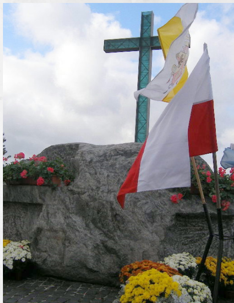
Włocławek – Tama na Wiśle

Od sierpnia 1980 był związany ze środowiskami robotniczymi, aktywnie wspierał NSZZ „Solidarność”. Po wprowadzeniu stanu wojennego organizował działania charytatywne. Pomagał ludziom prześladowany prześladowanym i skrzywdzonym. Brał udział w procesach rodaków, którzy byli aresztowani za przeciwstawianie się prawu stanu wojennego. Działalność ks. J. Popiełuszki ówczesne władze PRL uznały za krytykę i sprzeciw wobec systemu komunistycznego.