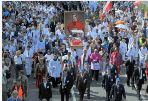
Świątynia Opatrzności Bożej