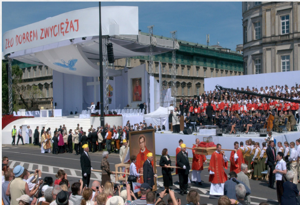
Beatyfikacja ks. J. Popiełuszki - Warszawa