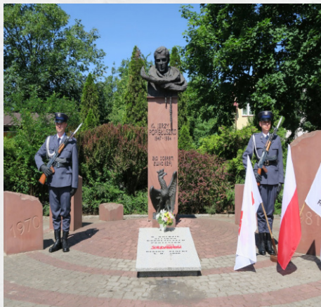
Pomnik ks. J. Popiełuszki – Płock „Stanisławówka”

Kapelan „Solidarności” został brutalnie zamordowany przez funkcjonariuszy Służby Bezpieczeństwa 19. X. 1984 r. we Włocławku. Zbrodnia ta poruszyła serca Polaków, wywarła duży wpływ na dalsze losy naszych rodaków. W 1984 r. ks. Popiełuszko został odznaczony Gwiazdą Wyrwałości. Następnie zarządzeniem prezydenta RP na uchodźstwie Ryszarda Kaczorowskiego z 11. XI. 1990r. został pośmiertnie odznaczony Krzyżem Kawalerskim Orderu Odrodzenia Polski. 13. X. 2009 r. ks. Jerzy Popiełuszko został odznaczony Orderem Orła Białego przez Prezydenta RP Lecha Kaczyńskiego.