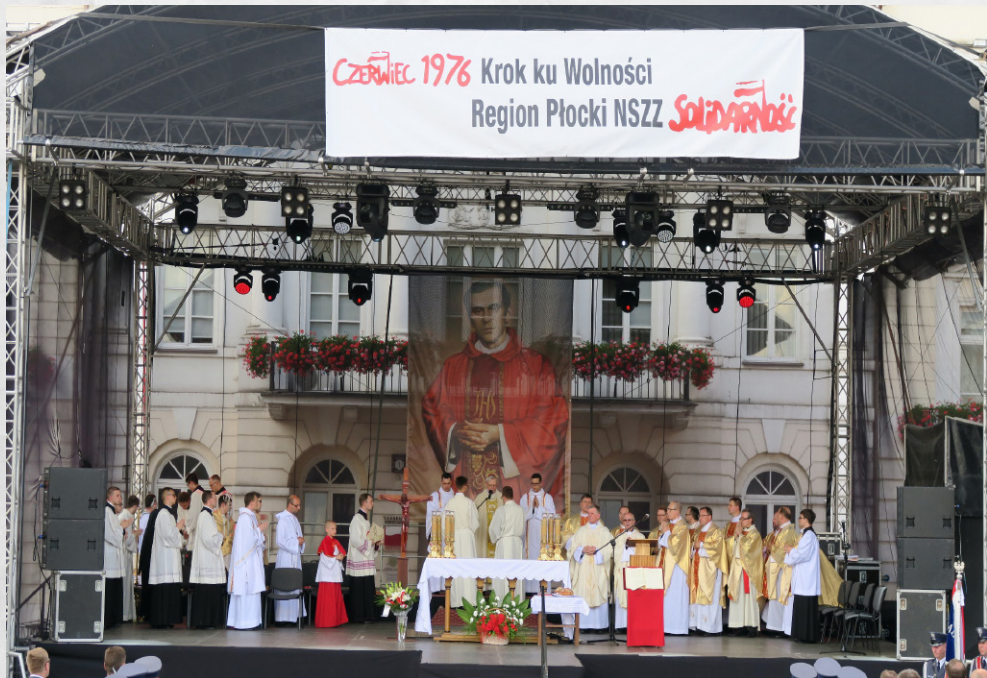
Płock, czerwiec 2016 r.