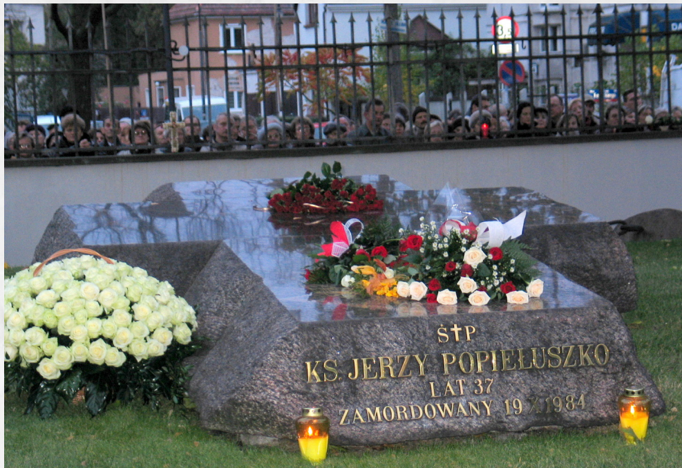
Warszawa, Pomnik ks. Popiełuszki