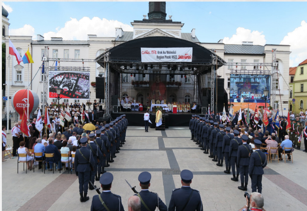
Płock, czerwiec 2016 r.