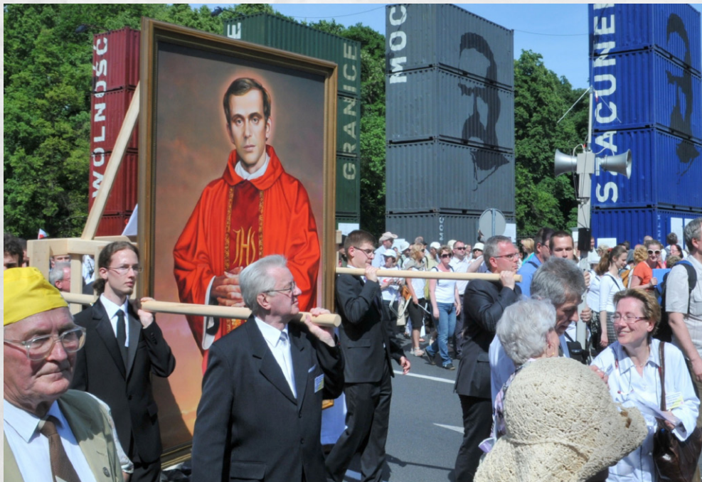
Beatyfikacja ks. J. Popieluszki 6.06.2010r.