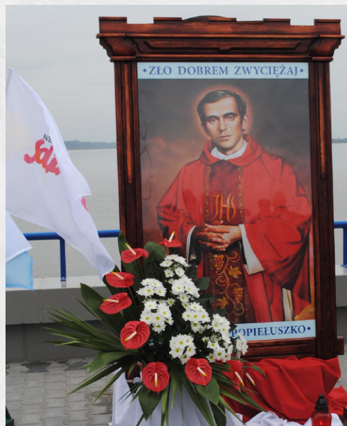
Włocławek – Tama na Wiśle

W latach 1974–1976 był studentem Studium Pastoralnego Instytutu Teologii Pastoralnej Katolickiego Uniwersytetu Lubelskiego. W 1978 został duszpasterzem środowisk medycznych w Warszawie.