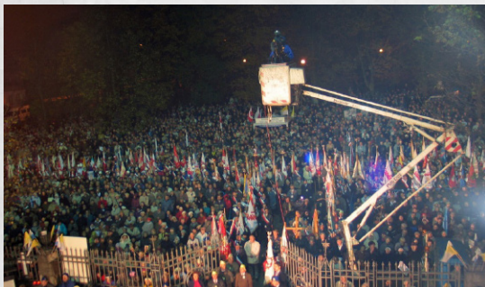
Warszawa; nabożeństwo w rocznicę śmierci ks. J. Popiełuszki 19.X.2004 r.