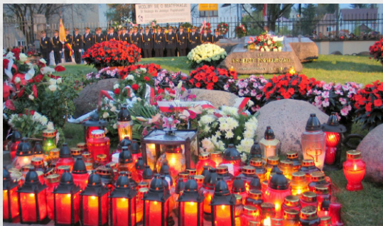
Warszawa - Pomnik ks. J. Popiełuszki 19.X.2004r.