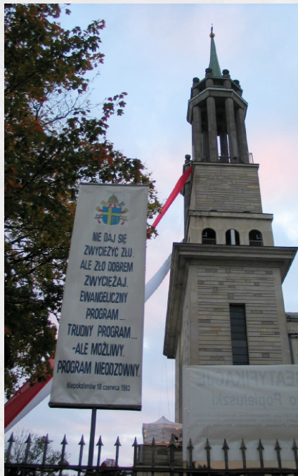
Sanktuarium Bł. Ks. J. Popiełuszki